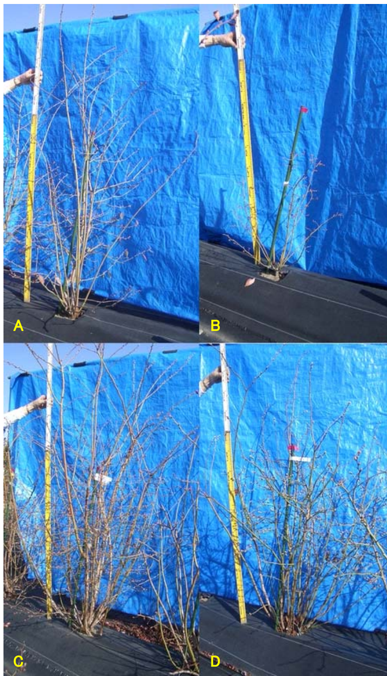
図2 高土壌pH圃場において生育旺盛な種間雑種個体（2年目）