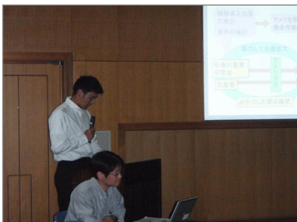
最優秀賞を受賞した新島村農業研究会