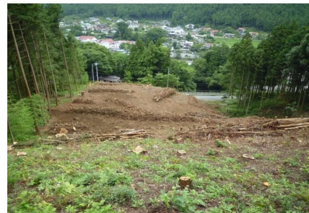
中腹部からの斜面の様子