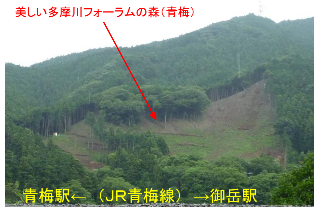
美しい多摩川フォーラムの森(青梅)