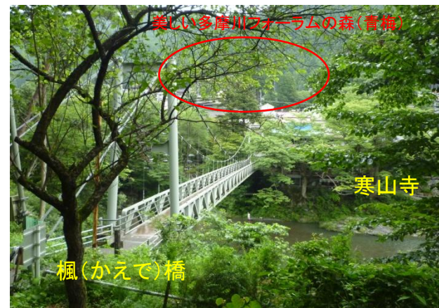
美しい多摩川フォーラムの森(青梅)