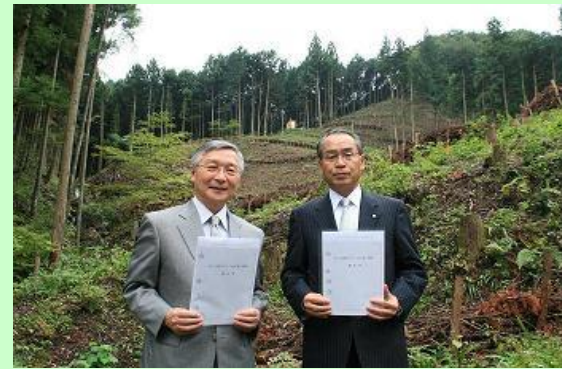
(美しい多摩川フォーラムの森を背景に 平成22年9月30日撮影)