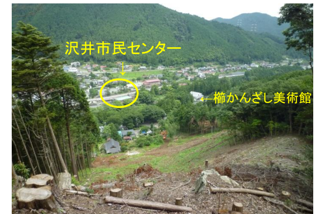
沢井市民センター