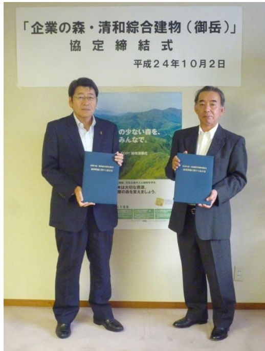
協定締結の様子 (H24. 10. 2)