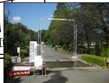
(東門) 消毒薬噴霧装置