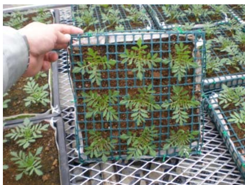
図2 出願部分：マット植物を枠体に入れて壁に固定する部分