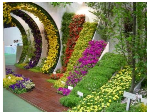
図3 花マットの展示例（ジャパンフラワーフェスティバルさいたま 2007. 6. 1～3：さいたまアリーナ）