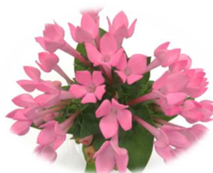
東京スター クリアピンク (品種登録出願番号33765)