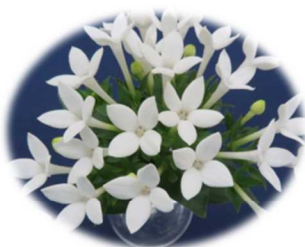
東京スター シルキーホワイト (品種登録出願番号33764)

a) 2017~2018年, 島しょ農林水産総合センター大島事業所にて調査 b) RHSは, RHSカラーチャート。色の和名は, 日本園芸植物標準色票の付表1「色名対称一覧表」より