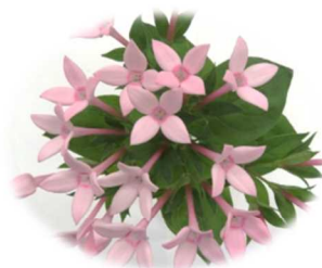
東京スター パールピンク (品種登録出願番号33766)