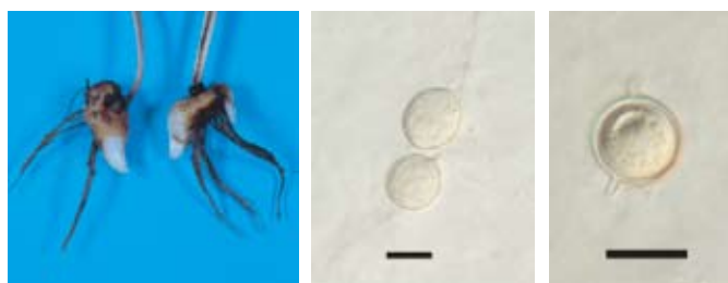
サンダーソニア根腐病 分生子 有性器官 Bar : 20 μ m