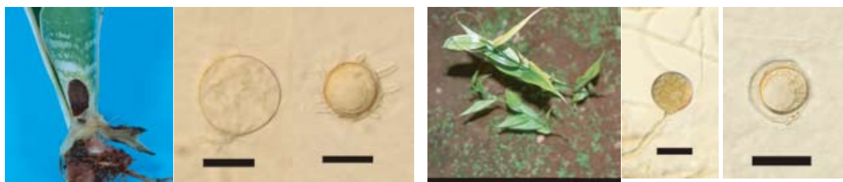
根部～葉身の腐敗症状 分生子 有性器官 Bar : 20 μ m