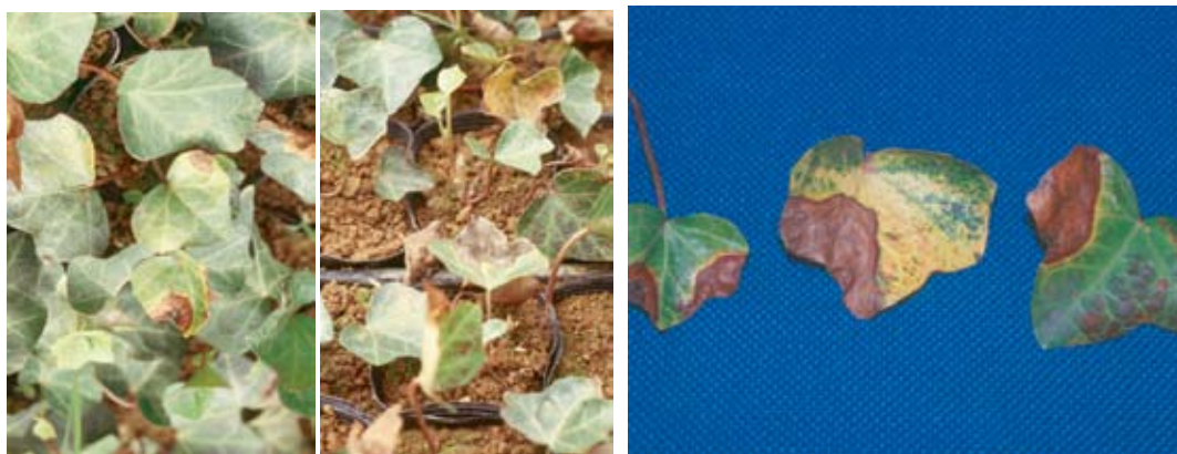
セイヨウキヅタの生産圃場における葉枯れ症状