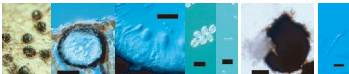
病斑上の分生子殻 Bar : 100 \mu m 分生子の形成 Bar : 20 \mu m 分生子 不動精子 Bar : 20 \mu m 子囊殻 Bar : 50 \mu m 子囊 Bar : 20 \mu m