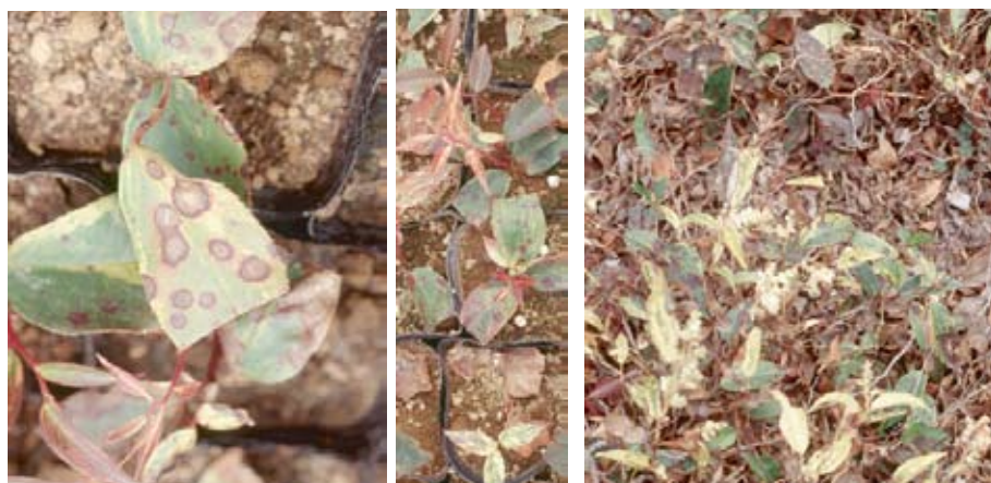
アメリカイワナンテンの生産地における病徴