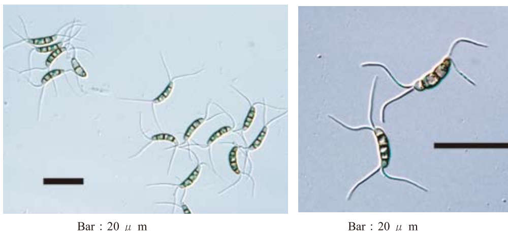
Bar : 20 \mu m