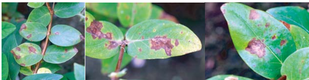
葉身の病斑:褐色～暗褐色の病斑が輪紋状に拡大, 融合して葉枯れを起こす