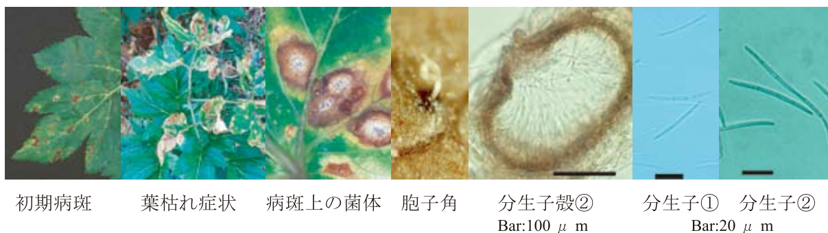
図 17-1 Septoria dearnessii Ellis & Everhart ①および Septoria sp. ②によるアシタバ葉枯病の病徴および病原菌の形態