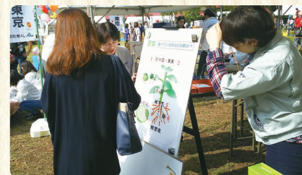
食べているのはどの部分?クイズ