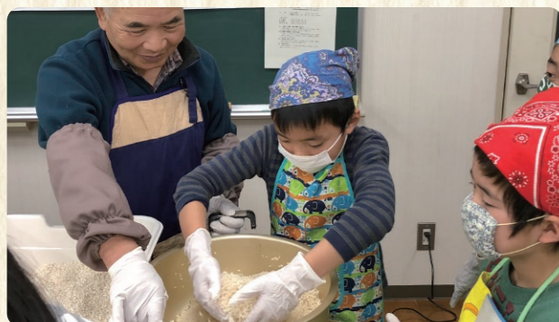
③こうじと塩を混ぜる