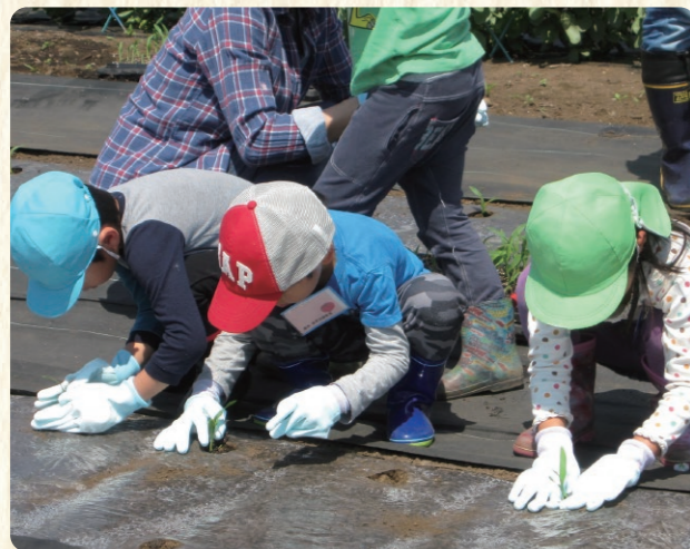
スイートコーンの定植(4月)