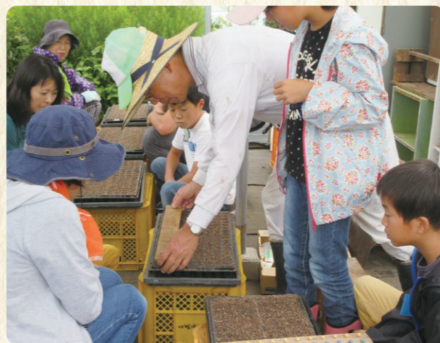
タマネギの種まき(9月)