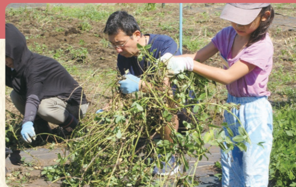
ラッカセイの収穫(10月)