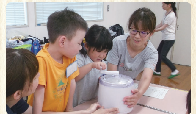
アイスクリーム作り