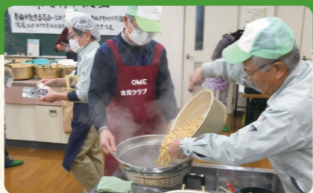
①大豆をやわらかく煮る