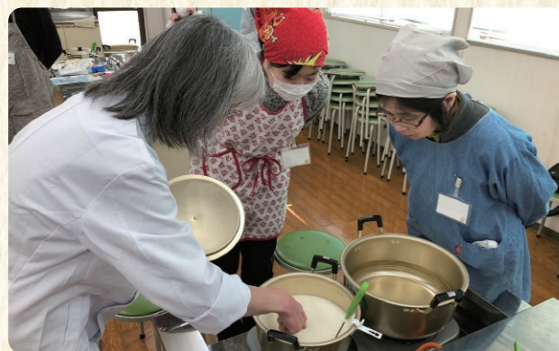
牛乳が固まってきたか確認