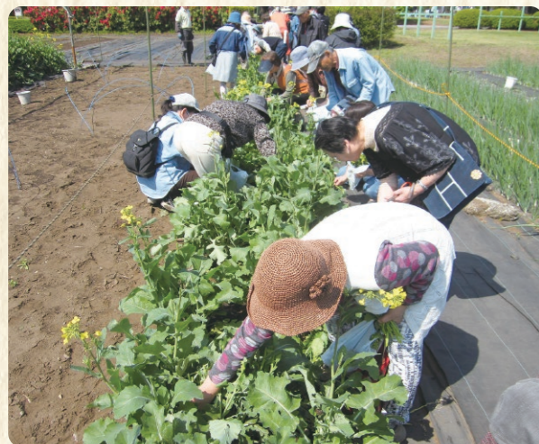
のらぼう菜摘み取り