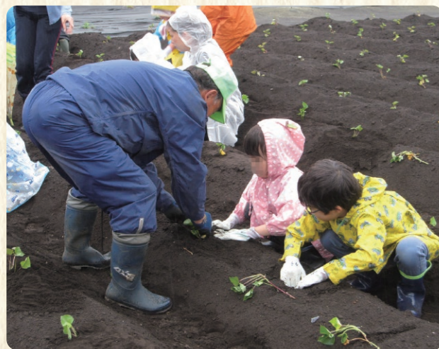
サツマイモの定植(6月)