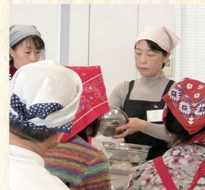
デモンストレーション