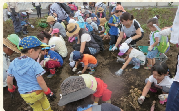
ジャガイモの収穫体験