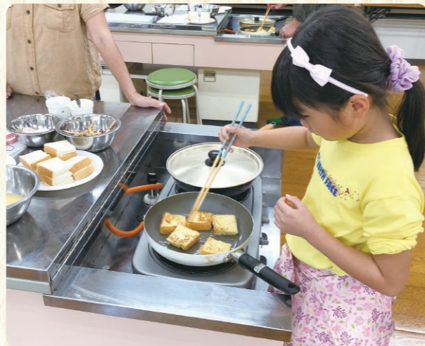
農畜産物料理教室 (大学イモをトッピングした フレンチトースト作り)