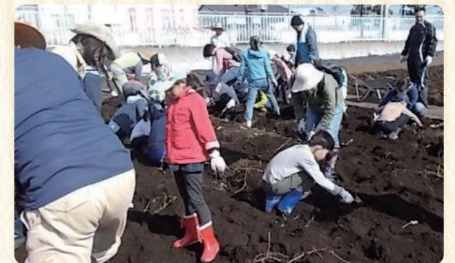
サツマイモの収穫体験