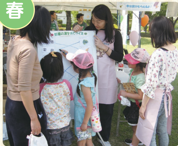
野菜の漢字あてクイズ