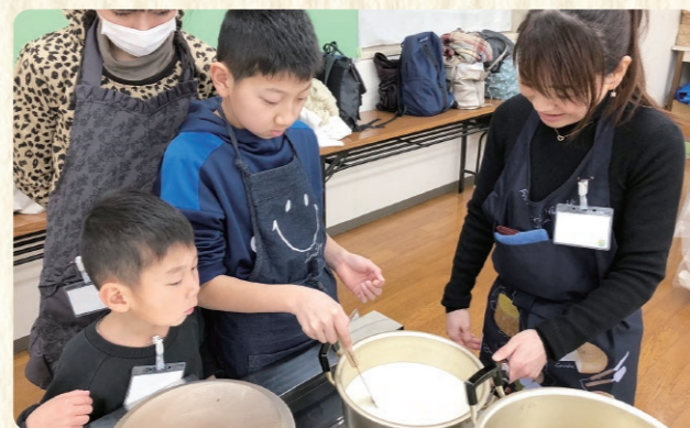
固まったカードを切る