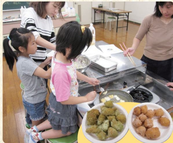
農畜産物料理教室