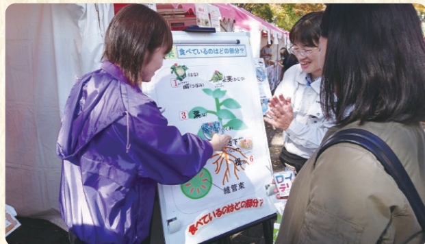
食べているのはどの部分?クイズ