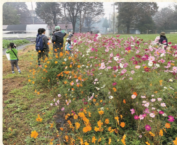
コスモス摘み取り