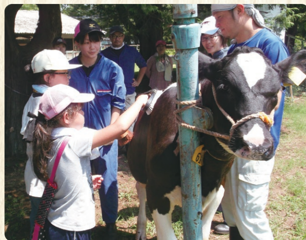
子牛のブラッシング体験(8月)