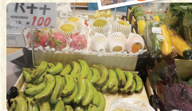
島しょの特産品販売