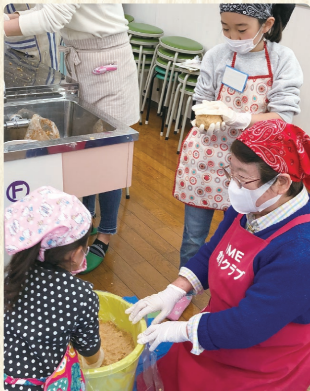
④味噌玉を作り 容器に詰める