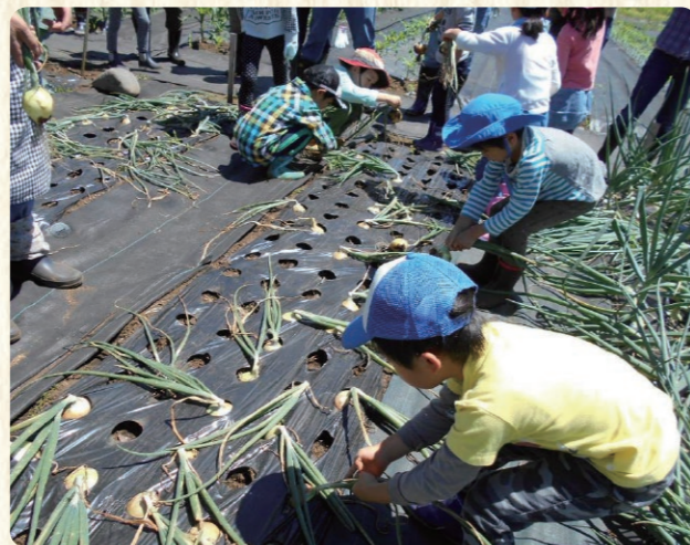
タマネギの収穫(5月)