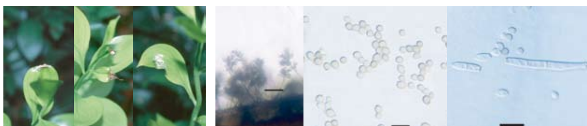
葉先と葉縁部の病斑