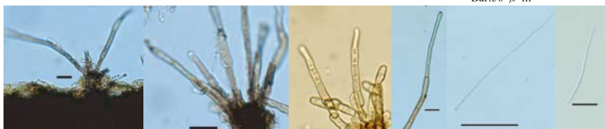
分生子座 Bar:20 \mu m