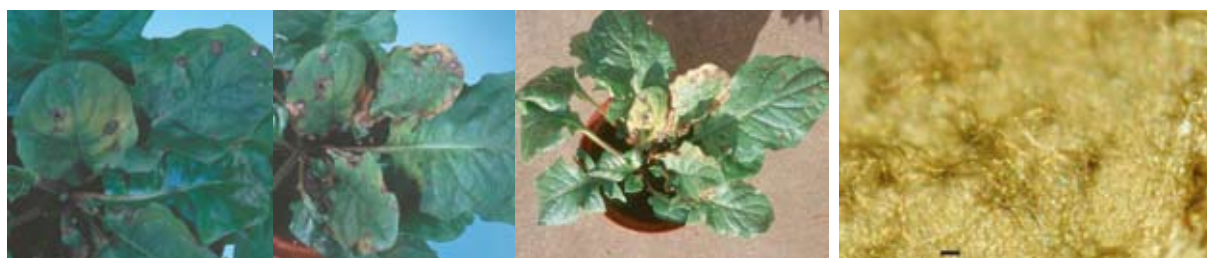
紫褐色の病斑および周辺部の退緑（黄化）