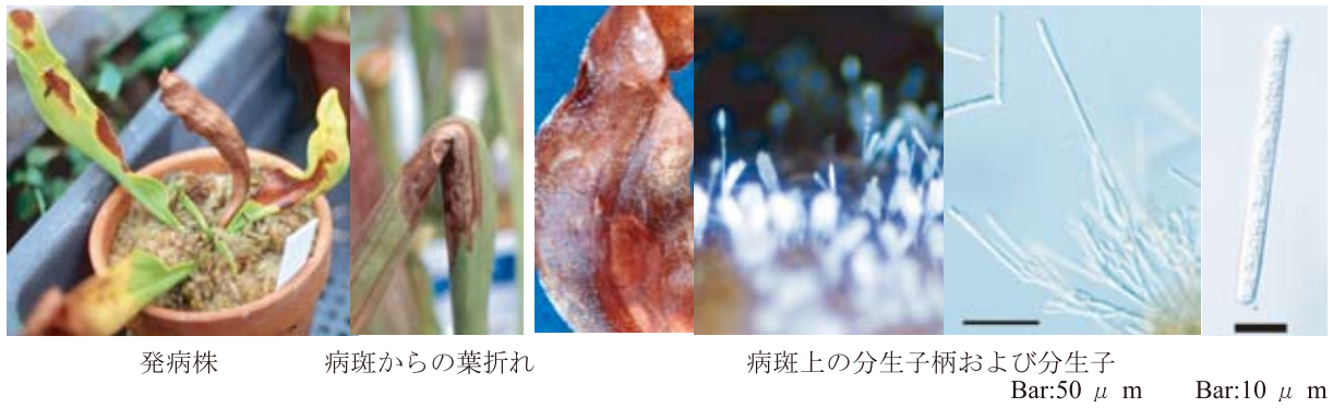
図 25-1 Cylindrocladium theae (Petch) Subram によるサラセニア褐斑病の病徴および病原菌の形態