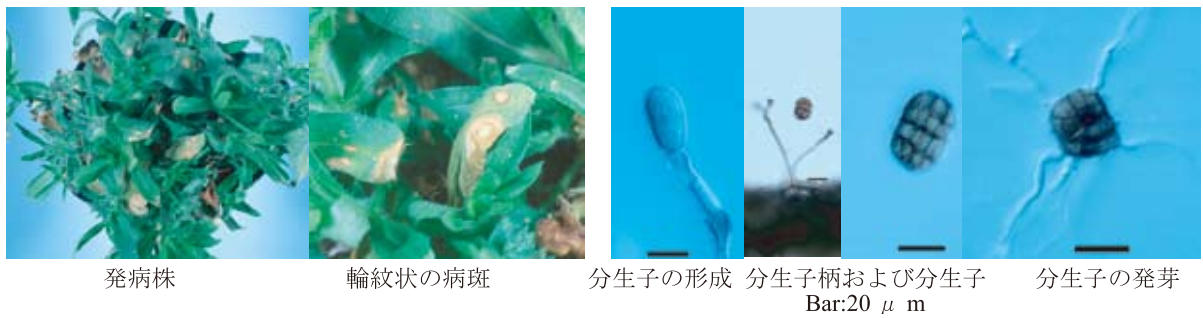
図 26-1 Stemphylium botryosum Wallroth によるフロックス斑点病の病徴および病原菌の形態