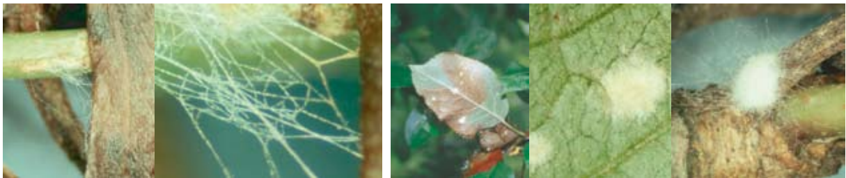
くもの巣状の菌糸