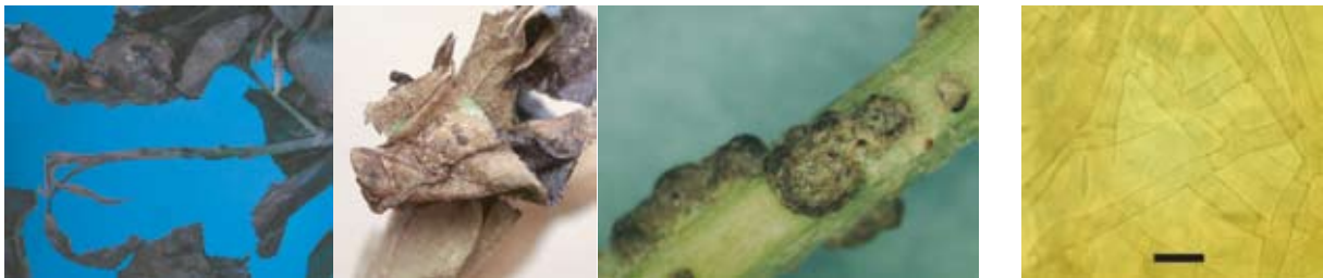
罹病部に生じた菌核