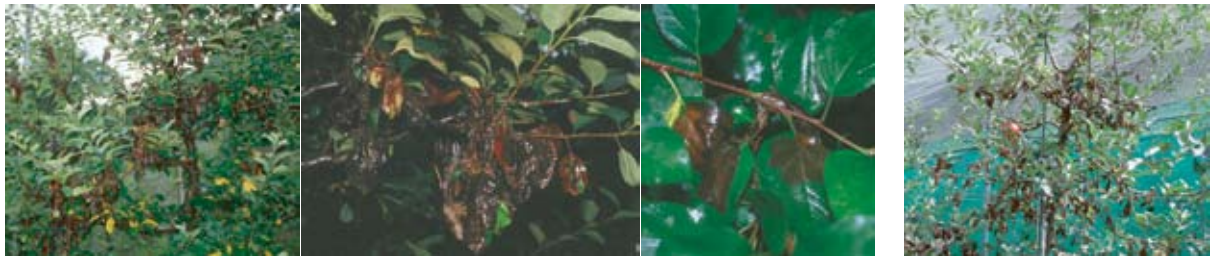
連続降雨時の病徴