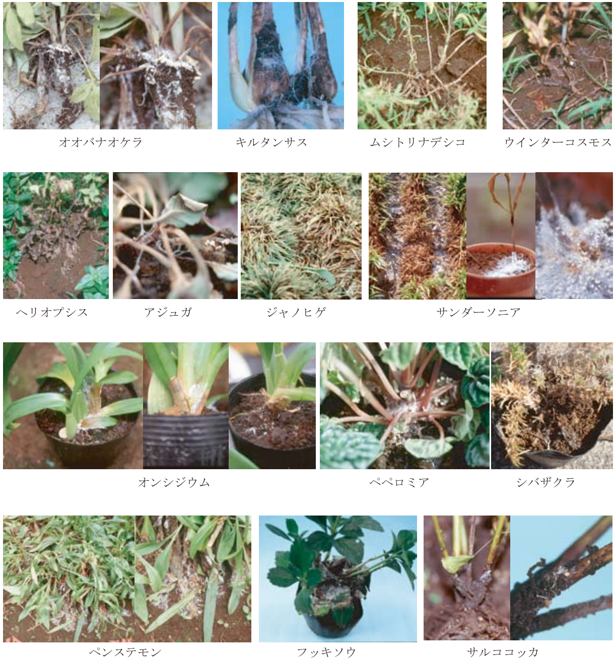
図 31-1 Sclerotium rolfsii Saccardo による白絹病の病徴