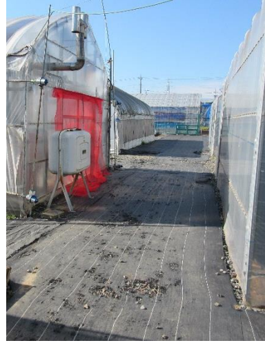
写真2 灯油タンク配置図⑩付近の未舗装道路