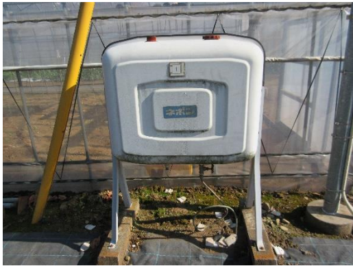
写真3 灯油タンク①187 ℓ