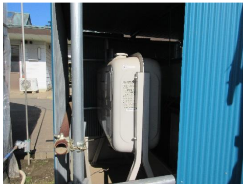
写真6 灯油タンク⑳224 ℓ