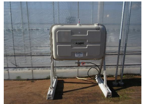
写真7 灯油タンク㉓198 ℓ