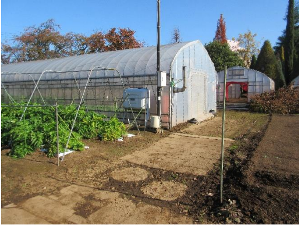
写真1 灯油タンク配置図②付近の未舗装道路