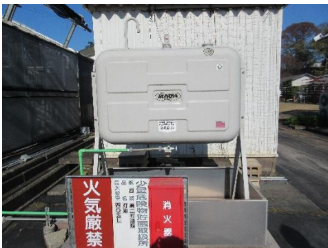
写真5 灯油タンク⑰405 ℓ