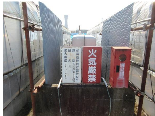
写真4 灯油タンク⑩468 ℓ