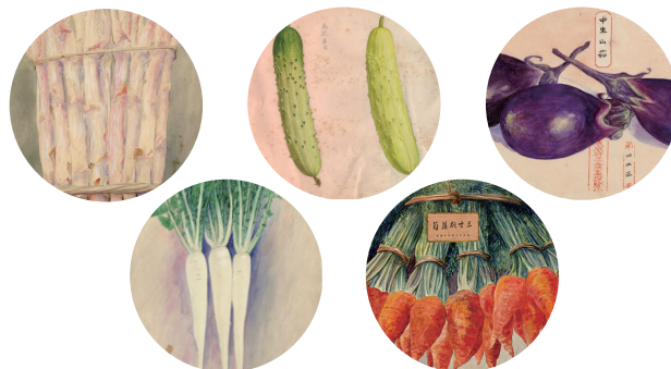
東京都農林総合研究センター所蔵 細密画より