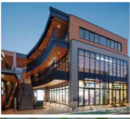
イオンタウン旗の台 (品川区)