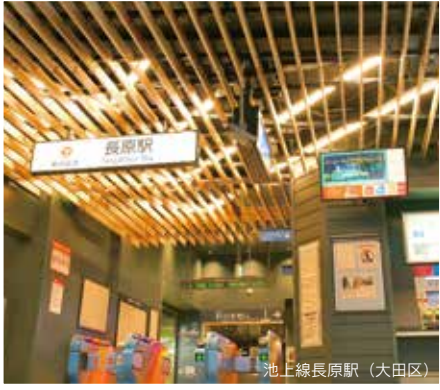
池上線長原駅 (大田区)