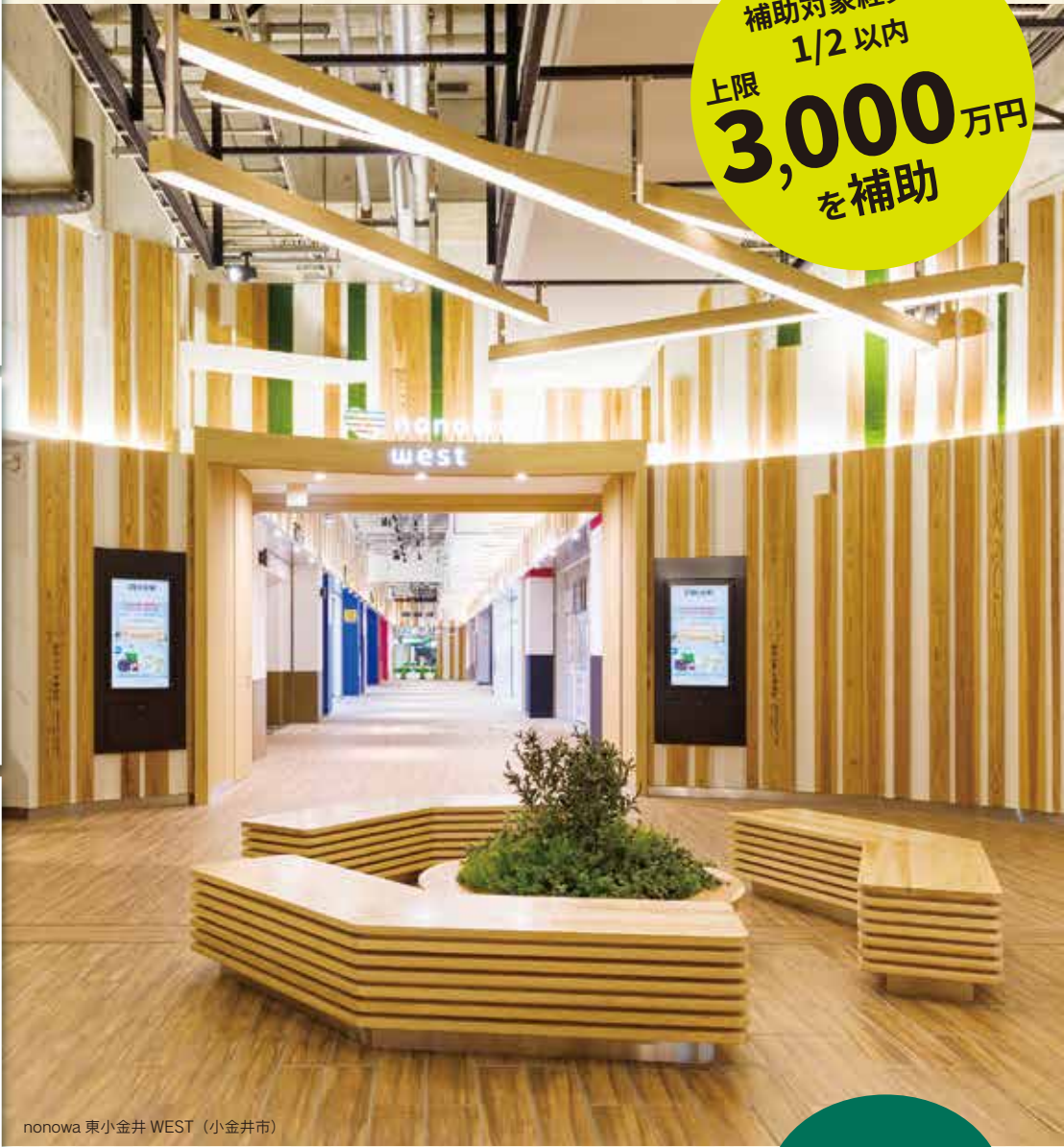
nonowa 東小金井 WEST (小金井市)