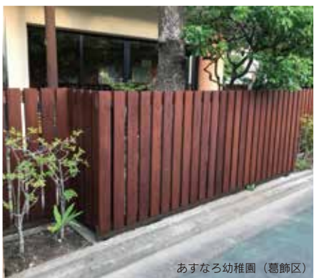
あすなる幼稚園 (葛飾区)