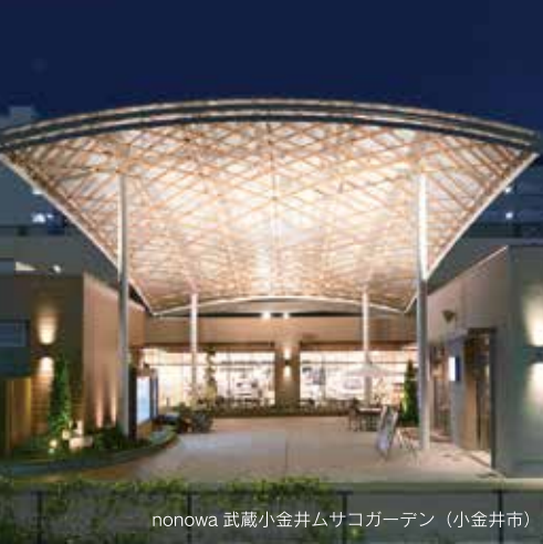
nonowa 武蔵小金井ムサコガーデン (小金井市)