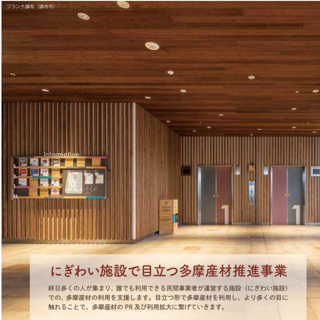
ランチ調布 (調布市)