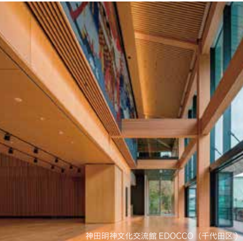
神田明神文化交流館 EDOCCO (千代田区)