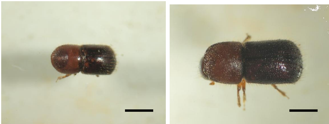
図2 アテモヤより採集されたキクイムシ類（スケールバー：1mm）

左：穿入孔より出ている木屑，右：被害が確認された，樹勢が落ちた誘引樹（矢印）。その右隣の誘引せず樹勢が落ちていない樹では被害がみられない。