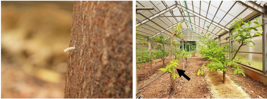
図1 キクイムシ類によるアテモヤ幹の被害

左：穿入孔より出ている木屑，右：被害が確認された，樹勢が落ちた誘引樹（矢印）。その右隣の誘引せず樹勢が落ちていない樹では被害がみられない。