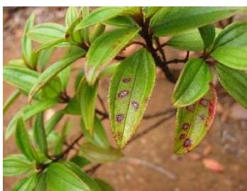
図8 ムニンボタンへスタチア病