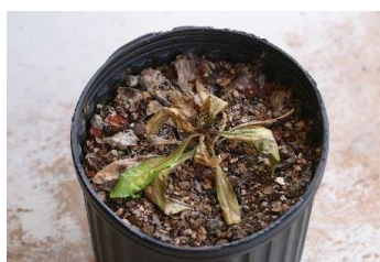
図3 オオハマギョウ株枯病