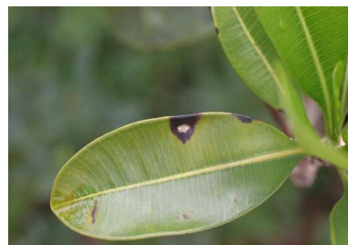
図6 ヤロード炭疽病