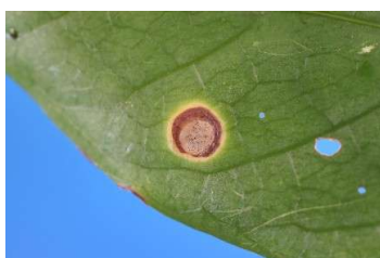
図2 シマギョクシンカへスタチア病