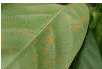
図1 オガサワラクチナシさび病