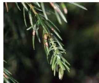
図9 シマムロへスタチア病