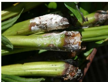
図10 オガサワラリュウビンタイ白絹病