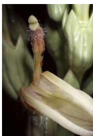
図4 オオハマギョウ花腐病