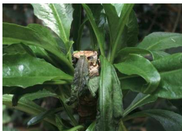
図5 ユズリハワダン菌核病