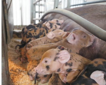
トウキョウX(エックス)

青梅畜産センターは、東京ブランド畜産物である「トウキョウX」、「東京しゃも」及び「東京うこっけい」の系統を維持し、種畜やひなを生産者に配付する事業を行っています。なかでも、系統豚「トウキョウX」の知名度は非常に高く、その肉は「TOKYO X」のブランド名で販売され、都内有名百貨店などで好評を得ています。