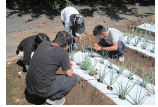
農業後継者に向けた農業技術研修