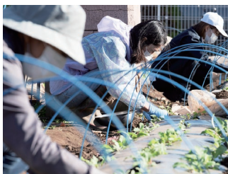
広域援農ボランティア

区市町村と協力して、農業に関心を持つ方々を対象に農作業の実習や講義を実施し、農業の担い手不足を補う援農ボランティアの養成を行っています。また、地域の枠を超えて活動する広域型の援農ボランティアの育成支援や登録・派遣を行っています。