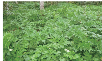
神津島のアシタバ

都内で生産されたキャベツや島しょ地域特産のアシタバなど、市場出荷物の価格安定を図るとともに、肉用子牛の生産や肥育経営を支援しています。