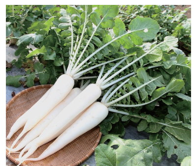
亀戸ダイコン(江戸東京野菜)の栽培試験

東京の東部地域における園芸分野を担い、高度集約型園芸技術の開発や、特産園芸作物における生産性・商品性の向上のための技術開発と品種の選定・導入などに取り組んでいます。