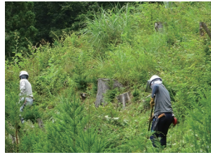
とうきょう林業サポート隊

東京の森林を整備するボランティアを募集し、伐採跡地等において、植栽、下刈、枝打ち等の活動を行っています(毎週水・土曜日)。