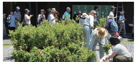
都民への苗木配布