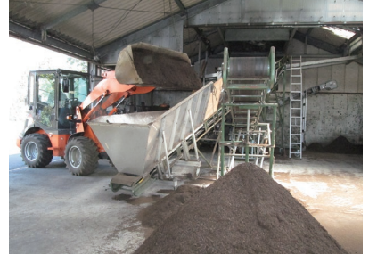
ふるいによる夾雑物の除去

有機農業堆肥センターは、環境と調和した環境保全型農業を推進するため、「土作り」に不可欠な優良堆肥を生産するモデルプラントとして設置されました。家畜ふんと剪定枝チップを混合した完熟堆肥を、生産者および一般都民の皆様に販売しています。また、令和元年度からは、東京都工コ農産物認証生産者に対する優先販売枠を設けています。完成した堆肥は、定期的成分分析を行うほか、堆肥中の残留農薬に関する試験を実施し、品質確保を図っています。