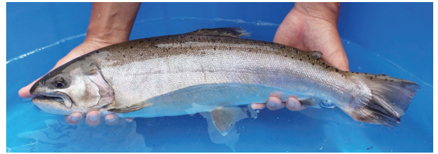
奥多摩やまめ(全長50~60cm:通常のやまめの約2倍)

奥多摩さかな養殖センターでは、ニジマス・ヤマメ・奥多摩やまめ・イwanaを養殖し、種苗(卵や稚魚)を生産して、河川漁協や養殖業者に配付しています。配付された種苗は河川に放流されるほか、養殖業者で大きく育てられて民宿や飲食店などで提供されています。当センターでは、入川飼育池と海沢飼育池の2か所で、稚魚の飼育と配付、親魚の養成と採卵を分担して行っています。