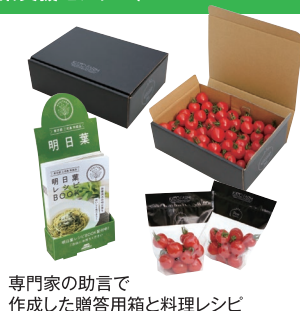
専門家の助言で作成した贈答用箱と料理レシピ

東京の強みを活かした魅力ある農業経営の展開を図るため、経営改善にチャレンジする意欲ある農業者等に対して、専門家を派遣してアドバイスを行うほか、新しい販路を開拓するナビゲータの派遣や販売促進・商品開発等新たな取組に必要な経費の一部を助成しています。