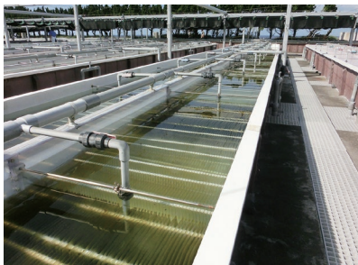
トコブシ稚貝の飼育水槽

栽培漁業センターは、栽培漁業(人工的に生産した卵や稚魚を自然界に放流し、成長後に獲る漁業)の中核基地としてサザエ・アワビなどの種苗(稚貝)の生産・配付を行っています。島しょ域における水産資源の維持増大を図り、地域の基幹産業である漁業の発展と都民に新鮮な魚介類を安定的に提供することを目指しています。また、種苗生産の技術改良に関する試験研究などにも取り組んでいます。