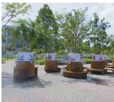
動かせる緑陰ベンチ(東京プロムナード公園)

緑化及び森林分野を担い、様々な都市空間における緑化技術、東京を彩る樹種の選定と生産技術、森林産業の育成や豊かな森づくりに向けた技術の開発などに取り組んでいます。