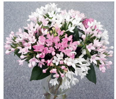
切り花用バラディア「東京スター」3品種 (令和元年8月30日 品種登録出願公表)

野菜、果樹、花き、バイオテクノロジー等の園芸分野を担い、高品質・高付加価値な東京オリジナル品種の育成や、生産性や品質向上に向けた技術の開発などに取り組んでいます。