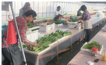
農福連携のための福祉農園

指定後30年経過等により買取り申出された生産緑地を、区市が農的な利用を目的として購入し整備する際に、経費の一部を補助します。