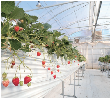
東京フューチャーアグリシステム®を活用したイチゴ栽培試験

東京における「稼ぐ農業」の実現に向け、民間企業や大学等の多様なセクターと連携し、ICTやAI等の先進技術を活用した小規模でも収益性の高い東京型スマート農業の技術開発に取り組んでいます。