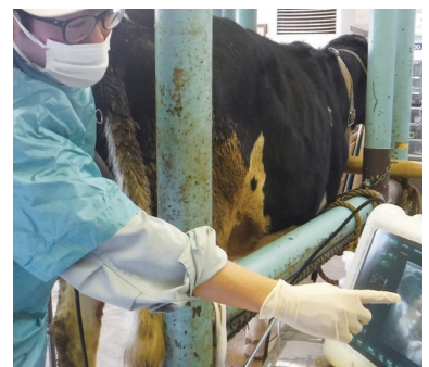
牛卵巣の超音波画像の確認

牛、豚、鶏等の畜産分野を担い、高品質で安全な東京ブランド畜産物の開発や維持改良、畜産の生産性向上技術、都市における畜産環境問題解決のための技術開発などに取り組んでいます。