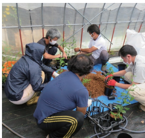
自主研究活動に取り組む後継者団体

また、農林水産業の担い手を中心とする団体が地域の課題を自主的に解決する取組や講習会の開催にかかる活動費などを助成するとともに、その取組の成果を発表しています。