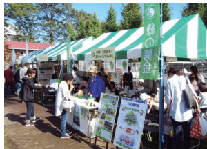
緑化イベント出展