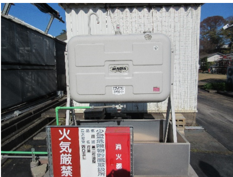
写真5 灯油タンク⑰405 ℓ