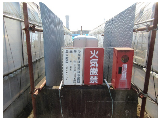
写真4 灯油タンク⑩468 ℓ