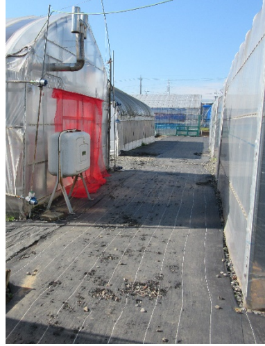
写真2 灯油タンク配置図⑩付近の未舗装道路