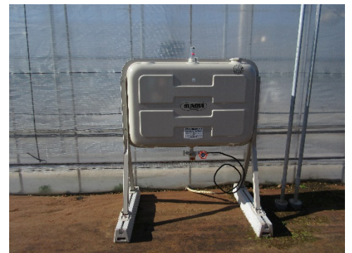
写真7 灯油タンク㉓198 ℓ