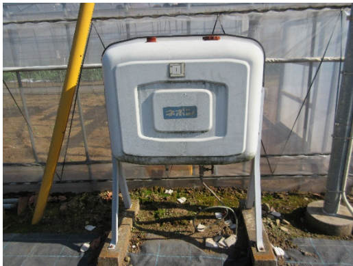
写真3 灯油タンク①187 ℓ