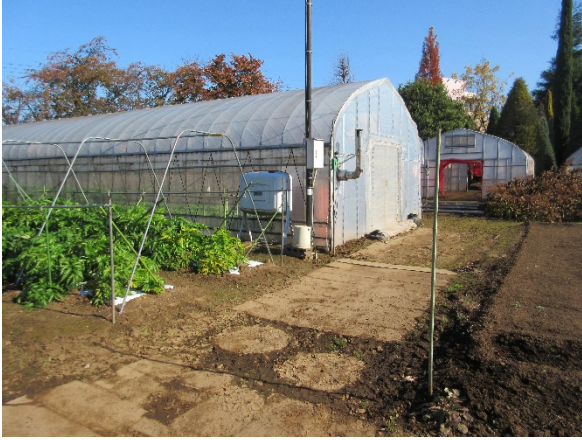
写真1 灯油タンク配置図②付近の未舗装道路